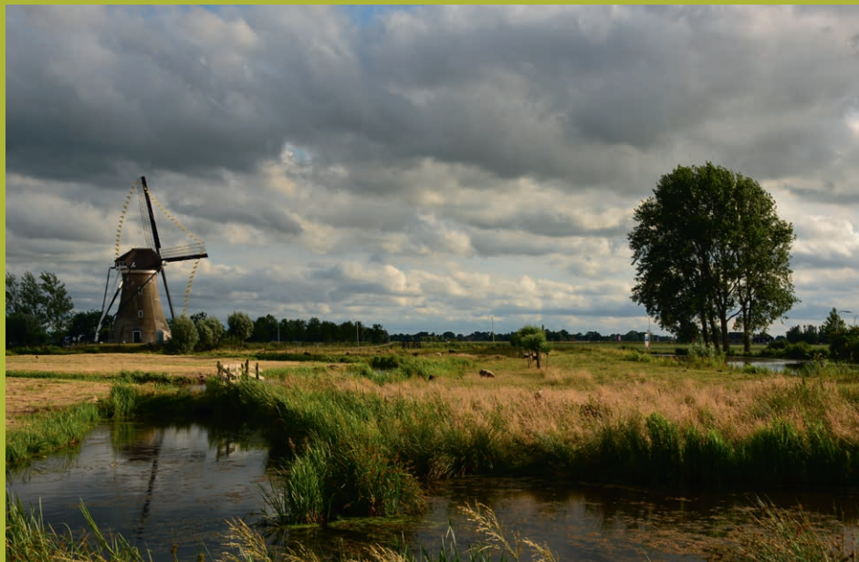
Rondom Boezemmolen no. 6 is het prachtig wandelen. Meer weten over de waterliniegeschiedenis? Boek dan het Waterwandelarrrangement 1672 via het Gemaal.