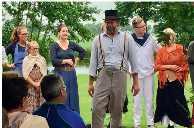
Theatrale fietsevenement De Boer Op.