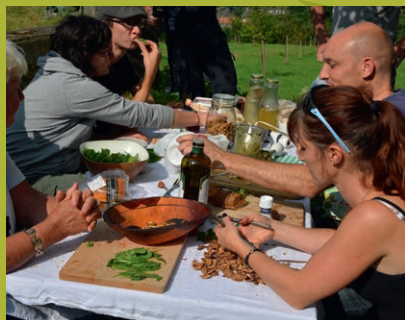
Bereid je eigen Liniemaaltijd van eetbare planten die je onderweg verzameld met een gids van Wandelen en Fietsen Krimpenerwaard.