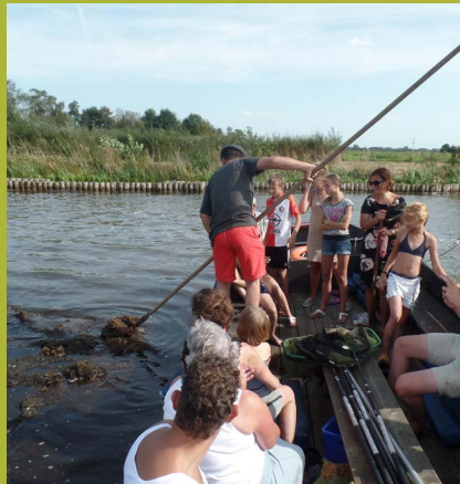
Met Watersnip kun je nog ouderwets de plas op en met een baggerbeugel veen opgraven.