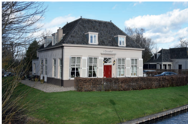
Het oudste gemeentehuis van Reeuwijk aan de 's-Gravenbroeksweg dat tot 1919 in gebruik was. Op dit moment een gemeentelijk monument.