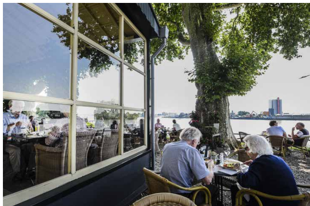
Bij Belvédère kunt u direct aan de Lek genieten van een hapje, drankje en indrukwekkend uitzicht.