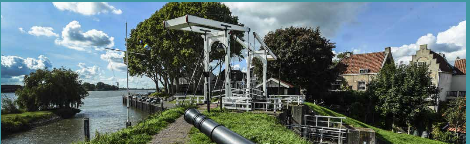
Schoonhoven vanaf het water, de romantiek komt je tegenmoet. Samen struinen langs de vele galerieën, leuke winkeltjes en eettentjes.