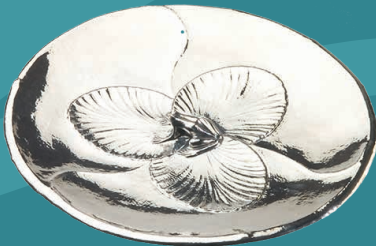
Kickerschaal van P. Heerens. Water als inspiratiebron. Te zien in het Zilversmuseum Designed bij Nature.